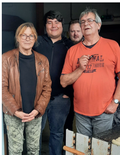
Die LINKEN am Grill